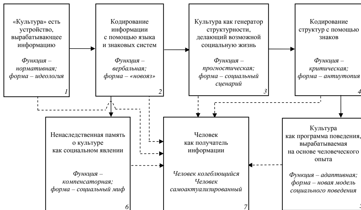
Рис. 2. Стадии информационного процесса в социокультурных системах (пунктирными линиями показаны направления воздействий на человека)

твенности происходило (и продолжает происходить) за многовековую историю меча. Меч становится знаком идеологий и религий, что фиксируется в вербальных формах «карающего меча» [16, с. 296–298], «меча правосудия», «щит и меч» etc. В структурности холодного оружия меч занимает верхнюю иерархическую позицию, кодируемую выражением статуса. Меч становится оператором молодежных субкультур, которые избирают его в качестве символа своей эксклюзивности. Однако следует отметить, что в настоящее время отсутствует та социальная структурность, которая соединяла утилитарную и символическую основы использования меча. Этот разрыв выражается в том, что наиболее актуальными для восприятия меча современным человеком становятся две стадии семиотической трансляции: кодирование ментальных (и идеологических) оснований, воплощаемых в мече, и оператор социального действия. В свою очередь, стадия кодирования определяет наполнение культурной памяти. Таким образом, в настоящее время меч воспринимается как обозначение социального мифа (блок 6, рис. 2) и в качестве символа модели поведения человека, имеющего право обладать мечом (блок 5, рис. 2). Культурные формы социального мифа и модели поведения связаны, соответственно, с двумя функциями: компенсаторной (как способа ухода от реальности) и адаптивной (как способа приспособления к реальному миру). Выявленные в ходе социологического исследования функциональные особенности меча в